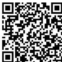
Страница изделия в интернете

http://les.ru/catalog/paneli-upravleniya-obshchego-naznacheniya/kr-21/